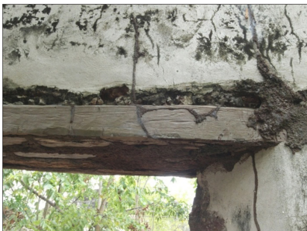
Figura 2. Los umbrales de madera curarire en el templo de San Pedro Apóstol

Los techos se apoyaron sobre las murallas y descansaban sobre “[...] ochenta y seis varas de soleras de ceiba labradas que han de correrse sobre el cuadro de las murallas y la [pared] que divide la sacristía contenidas en varias piezas [...]” 84 y también sobre las columnas, específicamente sobre sus capiteles; encima de ambos soportes se dispusieron “[...] seis soleras [alfarjas] de curarire y ceiba de tres varas y media de largo, las cuatro labradas y las dos en bruto [...]” 85 . Sobrepuestas a éstas se colocaron “[...] ocho sobresoleras de ocho varas de largo de palo de balaustre todas labradas [...]” 86 . Instaladas encima de las sobresoleras se dispusieron “[...] diez piezas de ceiba colorada [...] para recibir el techo trabajadas enteramente [...]” 87 y asimismo horizontalmente sobre “[...] ocho tirantes dobles de siete y media [varas] de largo para el cuerpo de la iglesia todos labrados [...]” 88 . Anexamente, se utilizaron siete tirantes sencillos para colocarlos entre los dobles y finalmente “[...] tres piezas de ceiba que componen veinte y seis varas y media para la corrida de la cumbreira, todas labradas [...]” 89 . Sobre esa armadura se colocaron 18.000 tejas traídas desde Maracaibo. Ese tipo de techo era el más empleado en las iglesias en Venezuela 90 y en la Nueva Granada, durante los siglos XVI, XVII y XVIII 91 .