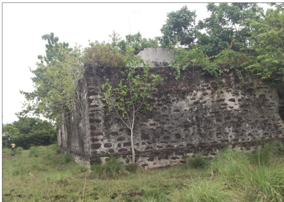
Figura 1. Detalle de los muros posteriores del templo de San Pedro Apóstol

“piedra de ojo”, también llamada “piedra de cal” o “coralina”, característica de la formación “El Milagro”, con una extraordinaria facilidad para ser trabajada por ser liviana y porosa, lo cual le permite al cantero apenas cortarla y labrarla con un hacha, aparte que en combinación con la cal le imprimía una gran fortaleza y resistencia a los muros 65 . Esa piedra usualmente se halla en las inmediaciones de la Nueva Zamora, y fue utilizada en aquella ciudad para construcción de paredes de mampostería y bahareque. El segundo tipo utilizado fue la piedra de canto rodado o de río 66 . El aprovisionamiento de esas rocas fue descrito en el informe realizado por don Juan Paulis Palmero en 1771, quien enlistó entre otros materiales “[...] la cuarta parte de piedra para los cimientos [...]” 67 . Ulteriormente en 1774, el Obispo Martí confirmó la existencia de “[...] trescientos burros de piedra de cantería [...]” 68 (Véase figura 1).