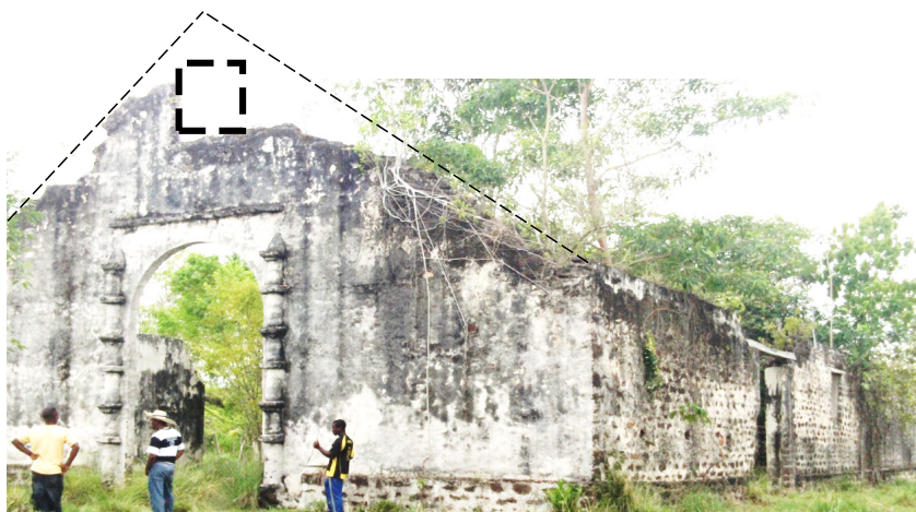
Figura 3. Fachada y muralla lateral en el templo de San Pedro Apóstol