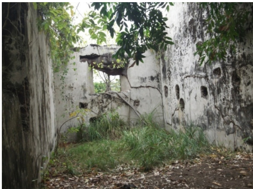
Figura 5. La sacristía del templo de San Pedro Apóstol

La edificación era única en comparación con el conjunto de iglesias elevadas en las riberas del Lago de Maracaibo, construidas generalmente con materiales perecederos, a excepción de las de Gibraltar y Nueva Zamora, y también debido a sus dimensiones, solidez y diseño. El templo de San Pedro se mantuvo en servicio hasta mediados del siglo XIX, cuando el puerto fue inundado por las corrientes del río Tucaní, después que este modificó su cauce y progresivamente sus pobladores lo abandonaron; hoy solo se mantienen en pie las ruinas del templo construido a finales del siglo XVIII 112 .